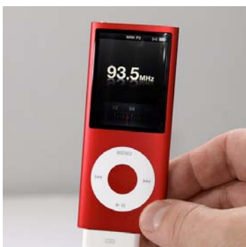
Den tunna Ipoden har dessutom videokamera och stegräknare.

att, som marknadsledare när det gäller både mobiletelefoner och mobila musikspelare, ta med FM-radio som en funktion i sina framtida Iphone- och Ipod-produkter". Apple har uppenbarligen lyssnat på radiobranschen. Den nya versionen av Ipod Nano har nämligen en FM-mottagare, som första produkt i Apples sortiment. (Radionytt) - Den inbyggda radion har en funktion Live Paus som gör att man kan pausa i direktsändning utan att missa något.